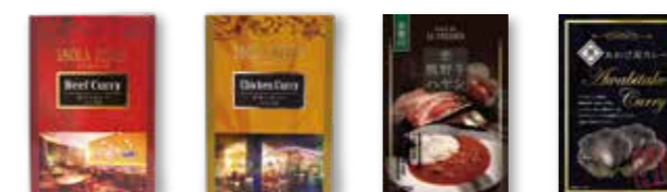
ビーフカレー チキンカレー 熊野牛ハヤシソース 黒あわび茸カレー