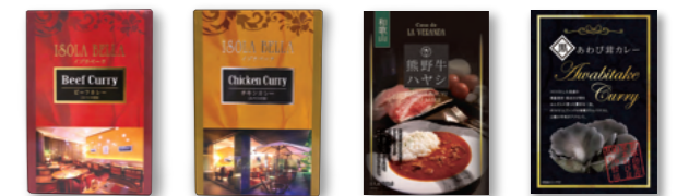
ビーフカレー チキンカレー 熊野牛ハヤシソース 黒あわび茸カレー