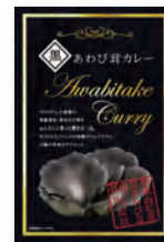
黒あわび茸カレー