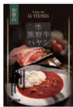
熊野牛ハヤシソース