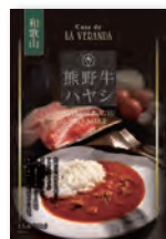
熊野牛ハヤシソース

赤ワインとトマトをたっぷり使用した熊野牛のハヤシソースと、まろやかでコクのあるチキンカレーをセットでご用意しました。いずれも当社オリジナルです。