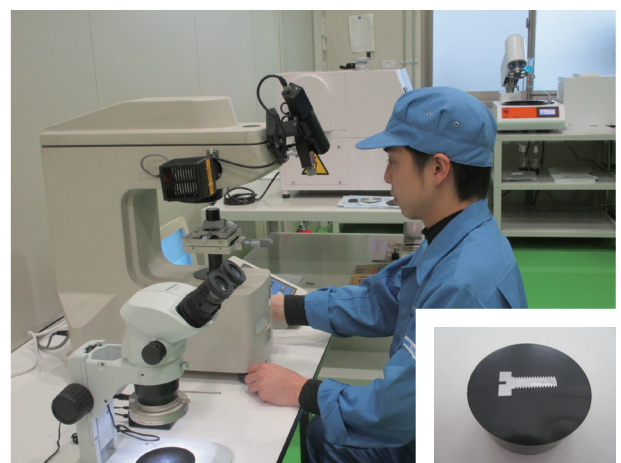
浸炭焼入れされた製品は正確な硬度を測定するため製品を樹脂埋め研磨した後、浸炭硬化深さを測定。