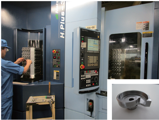
高精度横型マシニングセンタによる精密加工。