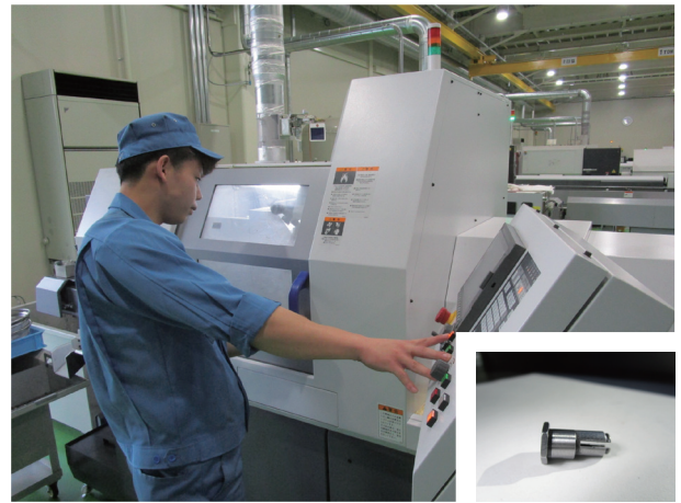
複合 NC 旋盤による精密小径加工。 また、同時偏芯加工も可能。